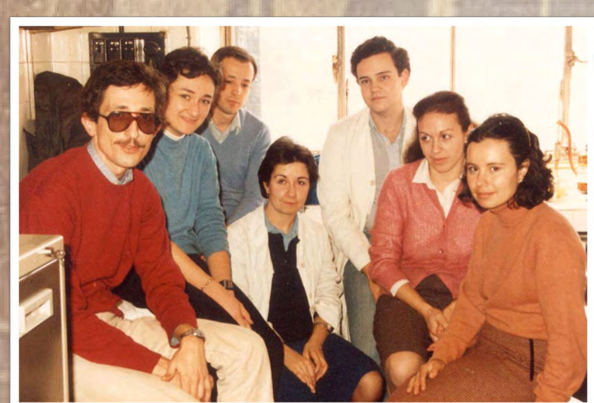
Profesores de Bioquímica (1984)