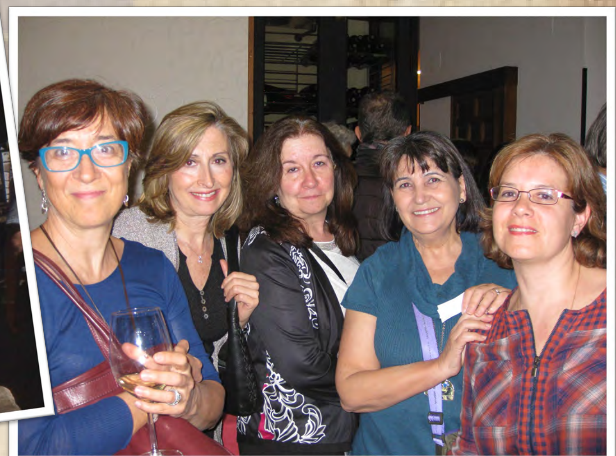
Profesoras de Bioquímica (2016)