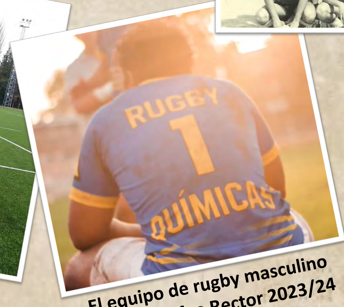
El equipo de rugby masculino gana el Trofeo Rector 2023/24