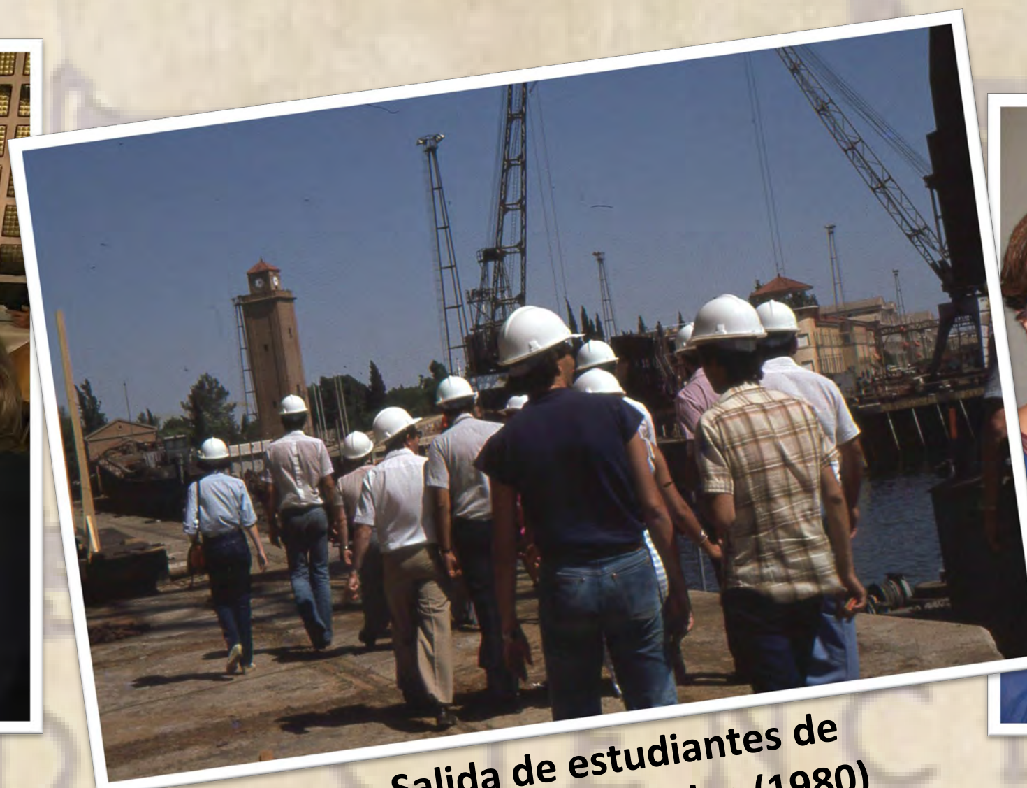
Salida de estudiantes de metalurgia a Huelva (1980)