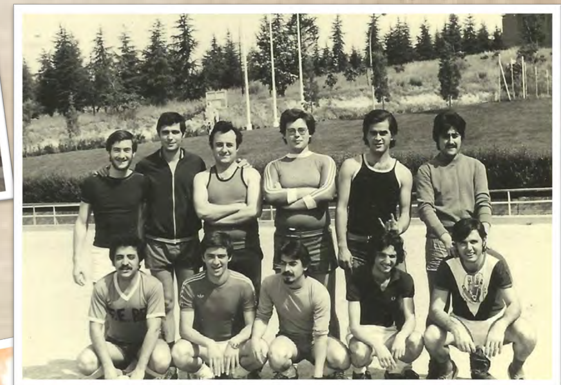
Equipo de fútbol de Química Analítica (curso 1978/79)