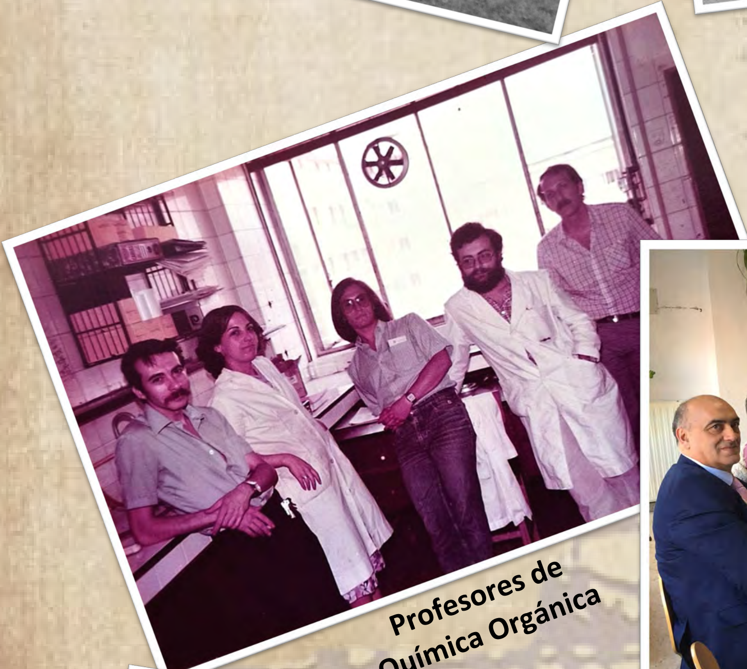
Profesores de Química Orgánica