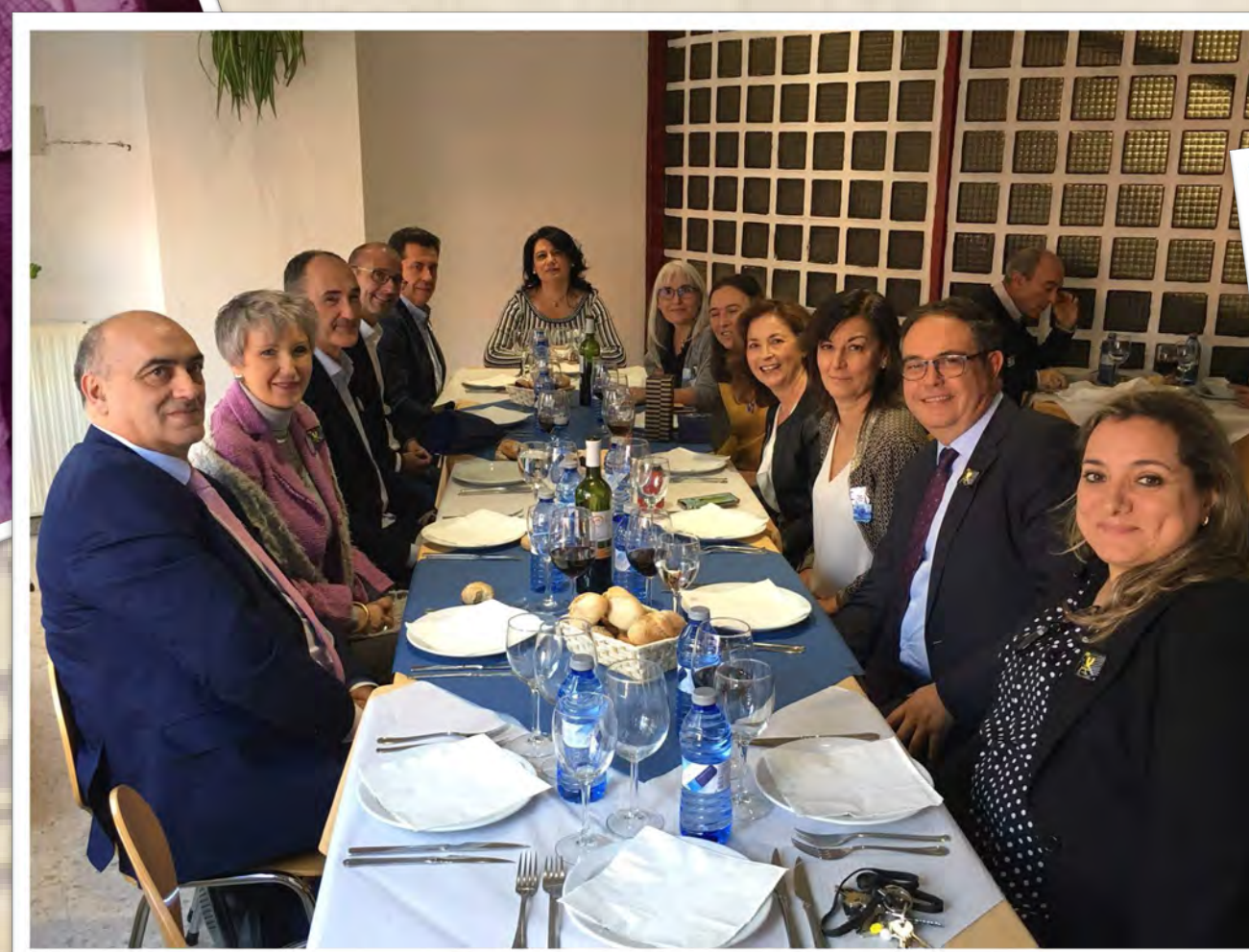
Comida San Alberto Magno (2019)