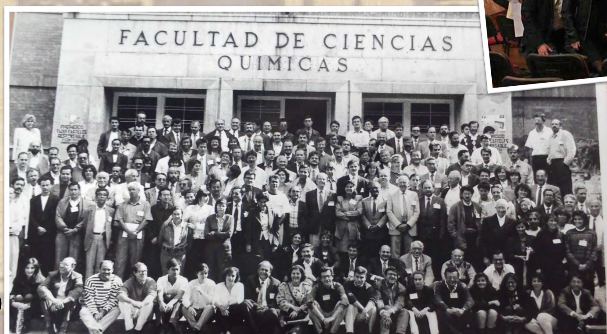
Congreso en la Facultad (1992)