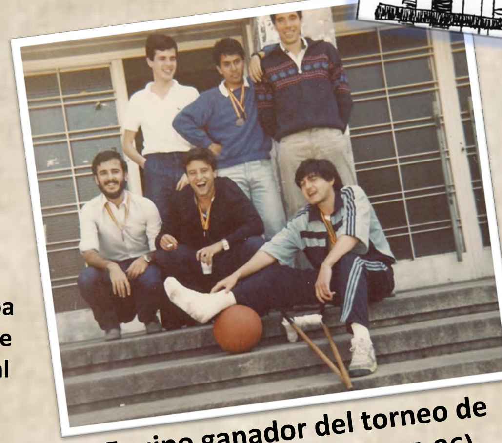
Equipo ganador del torneo de baloncesto (curso 1985-86)