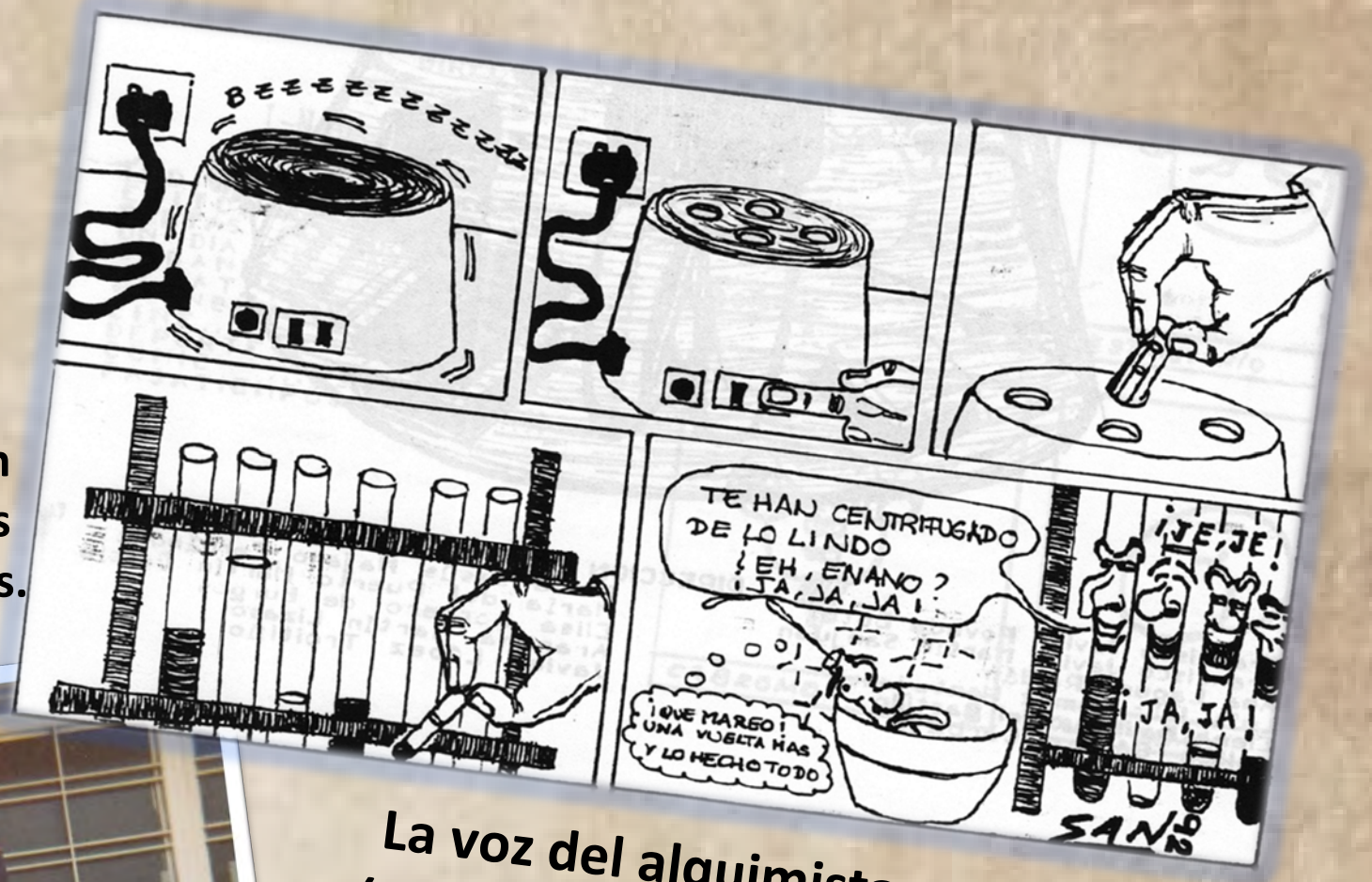
La voz del alquimista (número 3, abril 1992)

Los estudiantes de la facultad se han involucrado desde los primeros años en actividades culturales y deportivas.