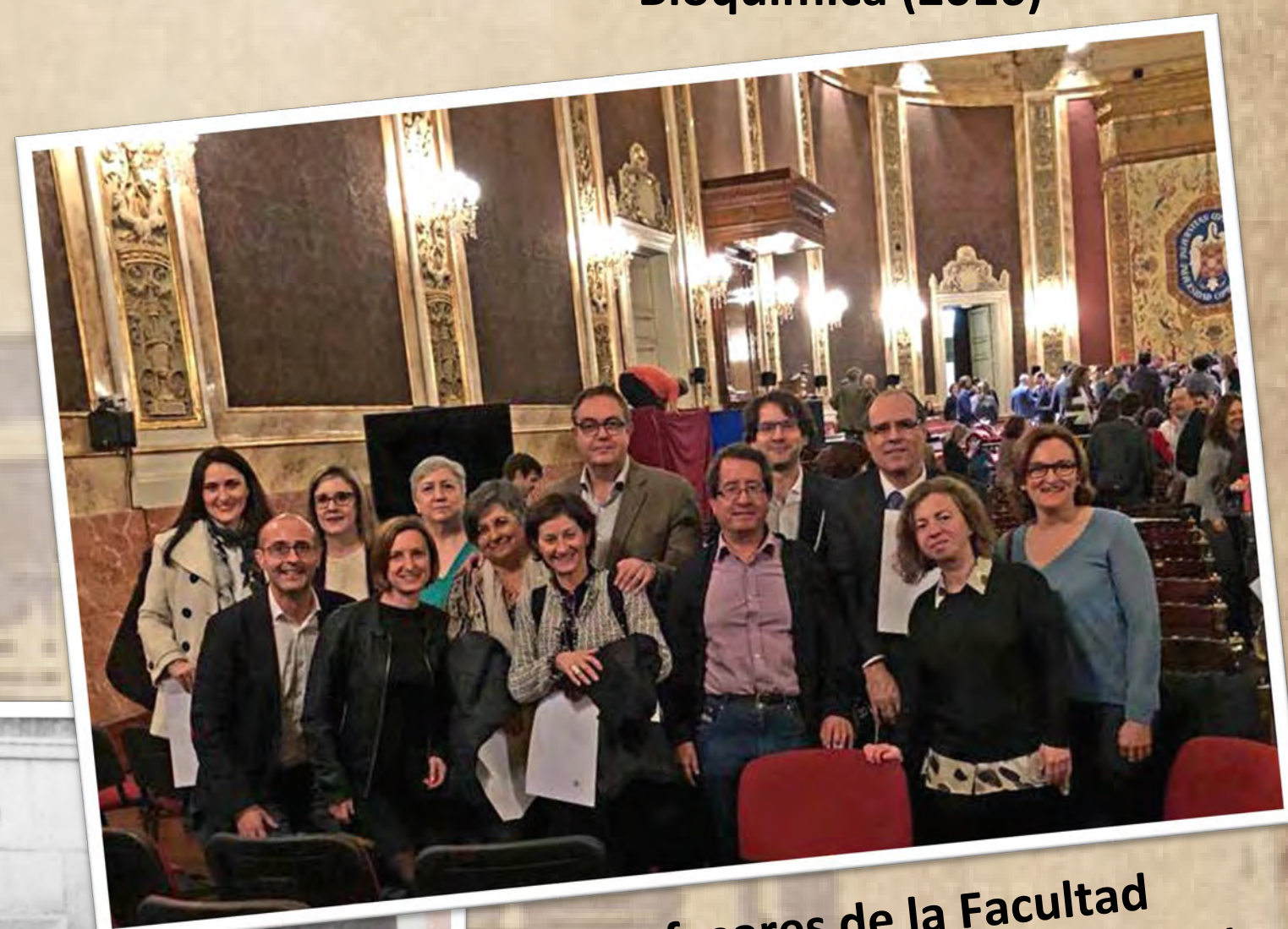
Profesores de la Facultad en el Paraninfo de la UCM (2018)

Entre la investigación, la docencia, la divulgación y la gestión, los profesores pasamos muchas horas al día en la Facultad (a veces casi más que en nuestras casas). Pero las actividades compartidas favorecen un ambiente laboral positivo y colaborativo que hacen que nuestro trabajo sea muy gratificante.